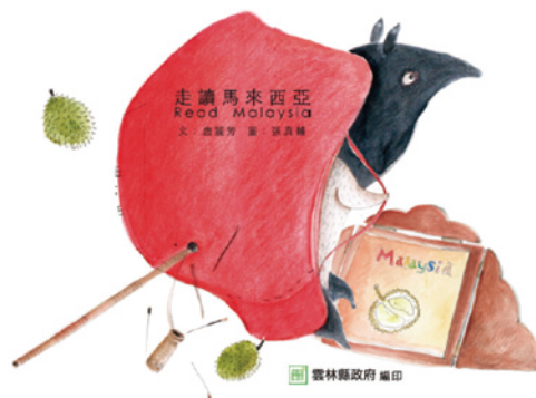
唐麗芳文；張真輔圖。《走讀馬來西亞》雲林縣斗六市：雲林縣政府，2017）。