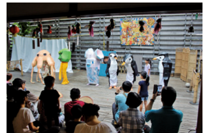
國際文化交流：共創 The Monkey's Tale 故事劇