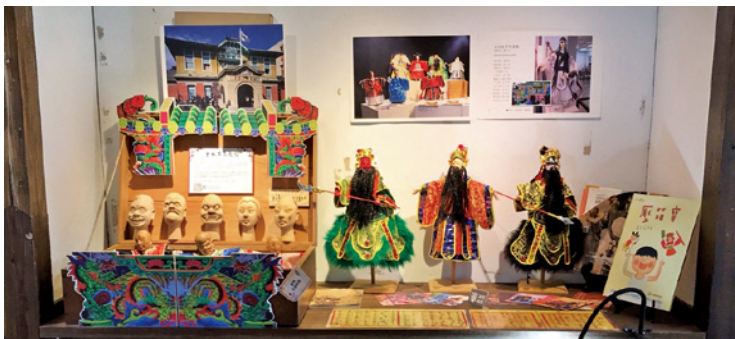
故事旅行箱「布袋戲館」