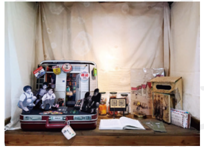
故事旅行箱「惠光二村」