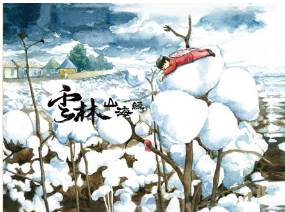
劉啓暉圖文。《雲林山海經》（雲林縣虎尾鎮：雲林縣雲林故事人協會，2014）。

雲林故事運動啟發馬、墨、澳洲、加等國成立故事館。營造 40 個國家、4,000 國際參訪人次。並且文化輸出至歐、亞、澳、美、中南美等 16 個國家。馬來西亞、澳洲、捷克、日本、美國等國作家、藝術家駐館。馬來西亞政府更邀約作家至該國進行深度故事文化交流。