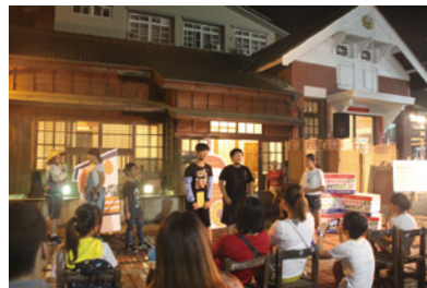
移動超市：六七十項 (2019)