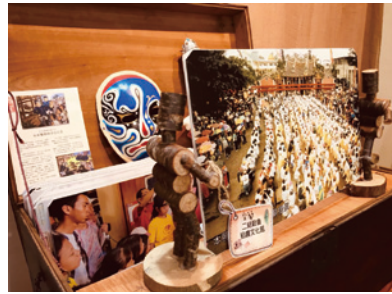
故事旅行箱「宜蘭二結」