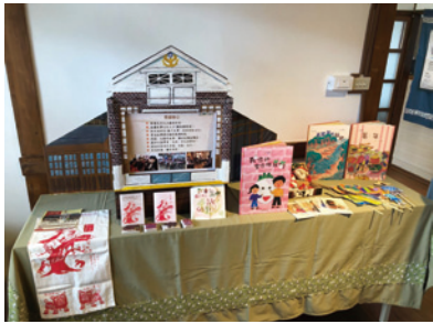
故事旅行箱「二崙故事屋」