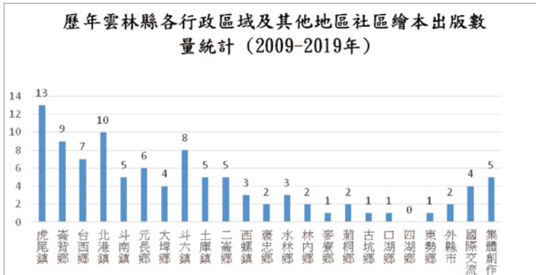
雲林縣各行政區域及其他地區社區繪本出版數量統計 (2009-2019 年)

* 本表統計來自雲林縣 20 個鄉鎮市行政區域及其他外縣市、國外的作者，2009-2019 年出版社區繪本的數量，共計 99 本 (不含再版 21 本)。