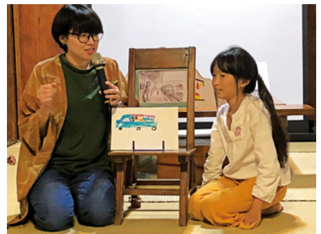
2019年3月辦理的故事旅行箱工作坊